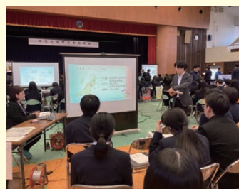
合同企業説明会（1・2年生）

卒業生の方や、県内で働く方々からの講話を聴く機会などもあり、進路選択の面で色々なサポートがあります。