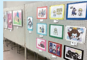
美術・イラスト部