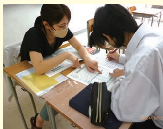
進路ガイダンス（3年生）

1年生の頃から企業説明会や会社の見学があり、進路選択の幅を広げて将来に生かすことができます。