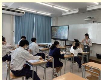
進学ガイダンス（2年生）

村松高校では、自分のやりたいこと、興味のあることに挑戦することができます。もしわからないことがあれば、気軽に相談できます。先生方は、一人ひとりの進路実現のために丁寧に対応してくれます。