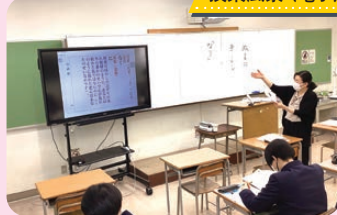
授業風景 (電子黒板の使用)

先生や仲間も優しく暖かい素敵な学校です。全校生徒全員で協力して頑張っていこうと思います。ぜひ、皆さん村松高校に来て下さい。(2年生)