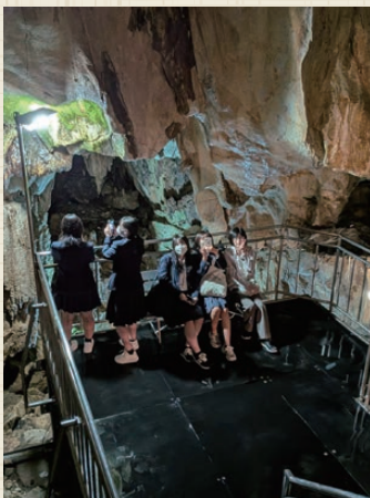
修学旅行(あぶくま洞)